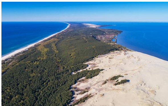
1 pav. Kuršių Nerija