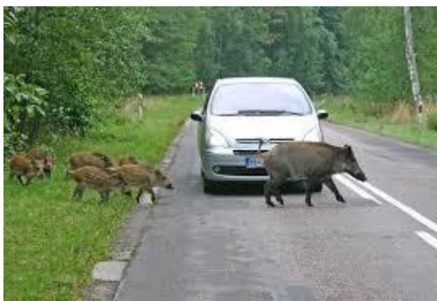
3 pav. Kuršių Nerijos šernai

Medžiojamųjų žvėrių gausai ir populiacijos kokybei reguliuoti 2018 - 2019 metų medžioklės sezono metu pagal „Naudojimo, tvarkymo ir mokslinio tyrimo programą 2018-2019 metams“ buvo numatyta iki keturių mokomųjų - parodomųjų medžioklių, kai medžiojama varant. Klaipėdos universiteto MMMPV 2018-2019 metų medžioklės sezono metu buvo įvykdytos 12 mokomųjų medžioklių, skirtų gyvūnų gausai ir populiacijos kokybei reguliuoti. Iš jų - 3 varant ir 9 tykojant ar sėlinant. Analizė rodo, kad mokslo ir mokymo medžioklės plotų vieneto teritorijoje medžiojamųjų gyvūnų vietinėms populiacijoms sureguliuoti tikslingiausia taikyti atrankinę medžioklę – tykojant, bei sėlinant, kai kuriais atvejais pvz. stirnų ir šernų gausai ir populiacijos kokybei reguliuoti rekomenduojamos ir medžioklės varant. Mokomųjų medžioklių tikslas gyvūnų gausai ir populiacijos kokybei reguliuoti, bei studentų supažindinimas su medžiokle, su medžioklės būdais, priemonėmis ir kt.